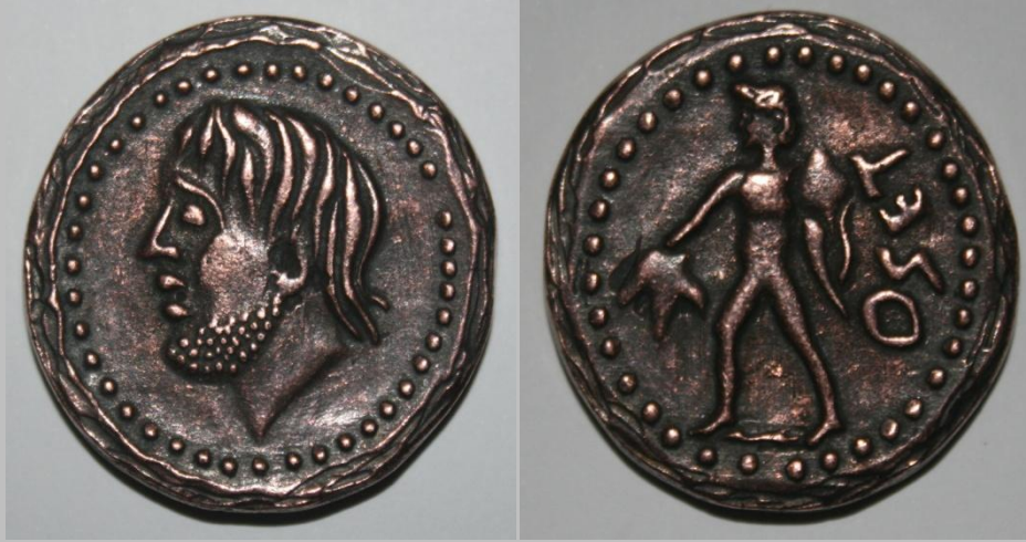
Anverso y reverso de reproducción de moneda romana

Por último, señalar que el contenido de este proyecto se adaptará a las características de los grupos y sus edades.